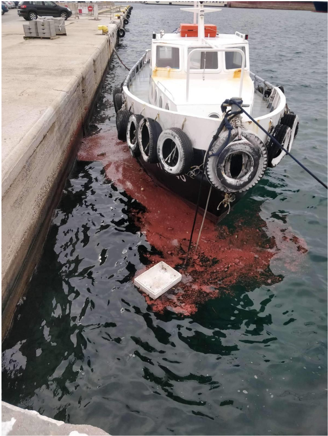
2_Η ρυπαντική ουσία 7_1_2021.JPG