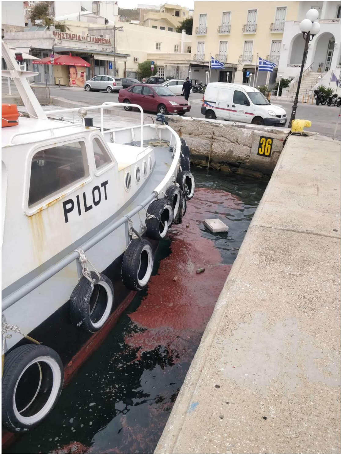
1_Η ρυπαντική ουσία 7_1_2021.JPG