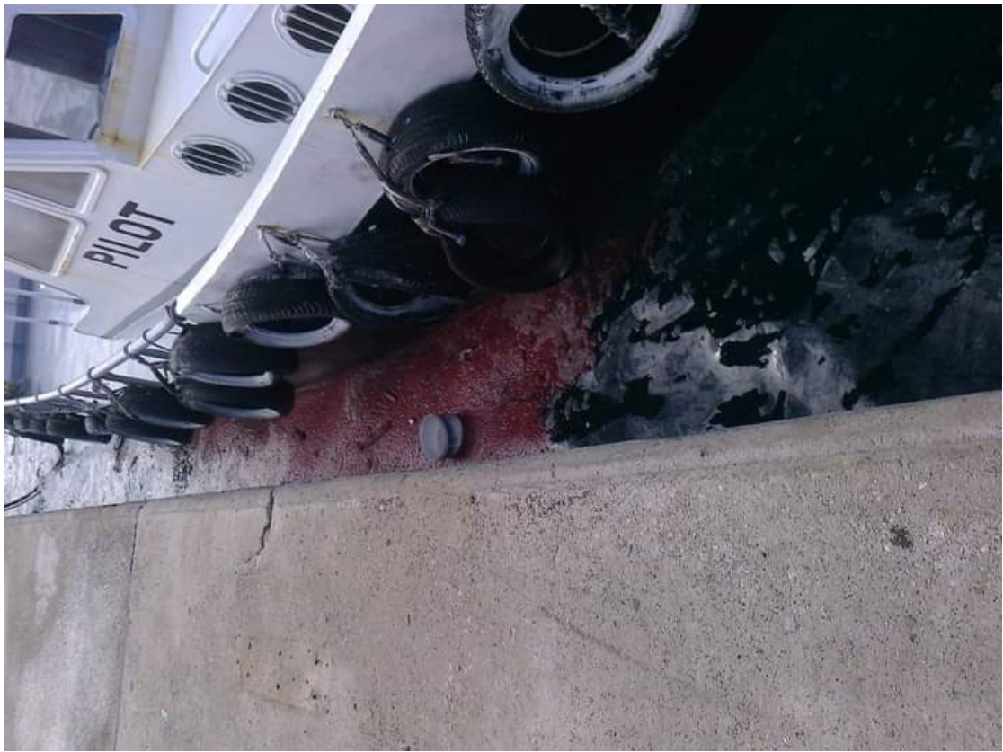
Αρχείο: "2 ΡΥΠΑΝΣΗ ΛΙΜΕΝΑ _7-12-2020.jpg"