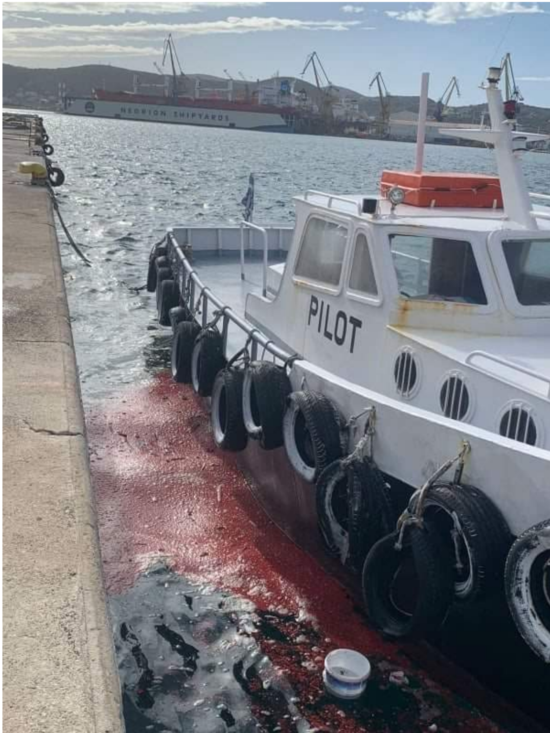
Αρχείο: "1 ΡΥΠΑΝΣΗ ΛΙΜΕΝΑ _7-12-2020.jpeg"