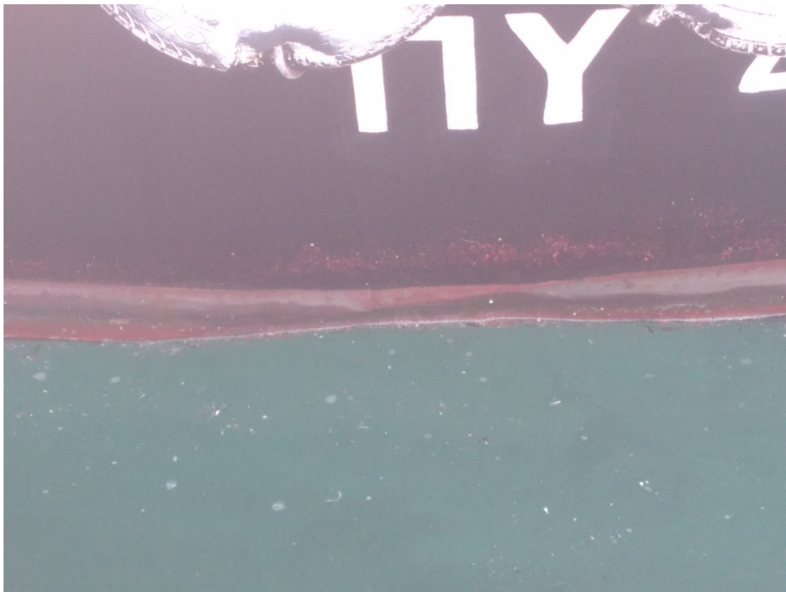
"9 ΡΥΠΑΝΣΗ ΛΙΜΕΝΑ _8-12-2020.jpg"