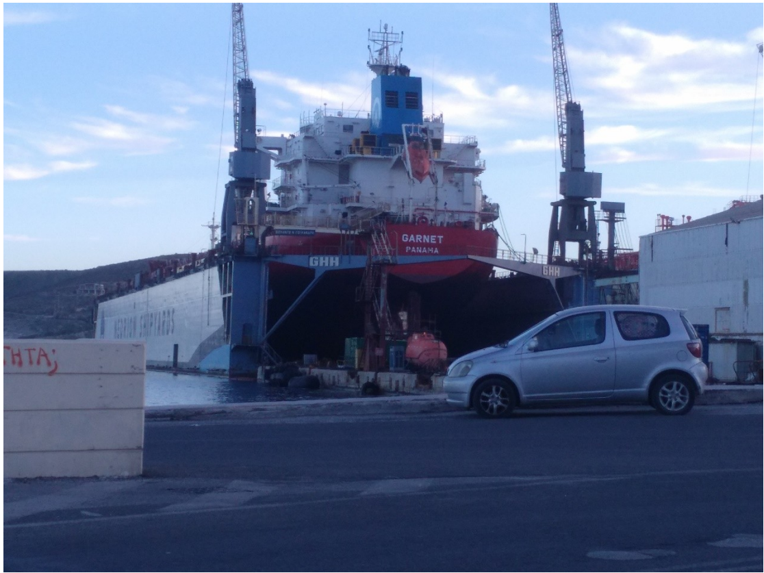
"7 ΡΥΠΑΝΣΗ ΛΙΜΕΝΑ _8-12-2020.jpg"