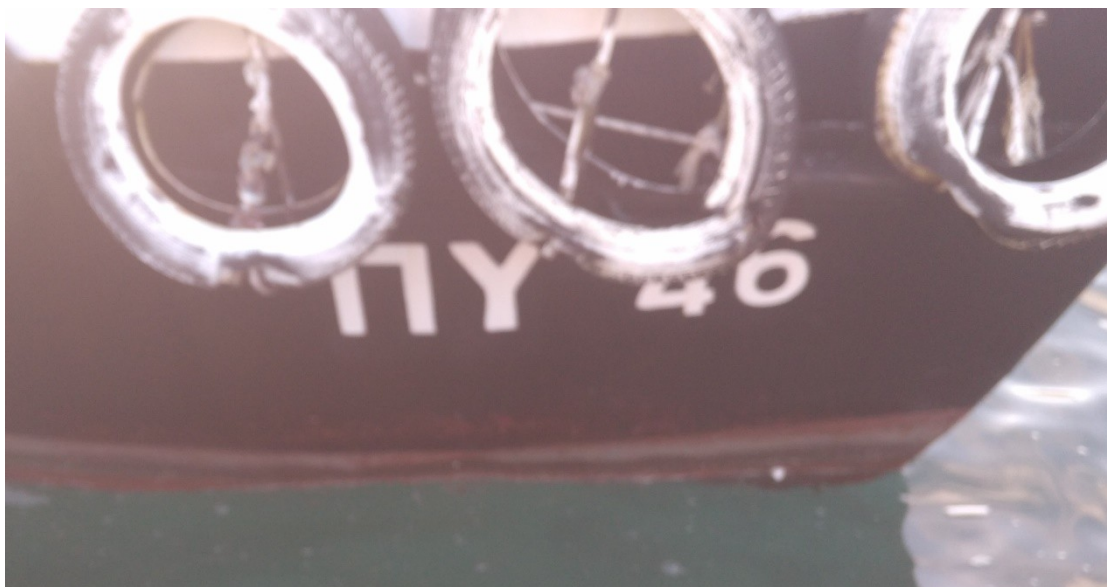
"8 ΡΥΠΑΝΣΗ ΛΙΜΕΝΑ _8-12-2020.jpg"