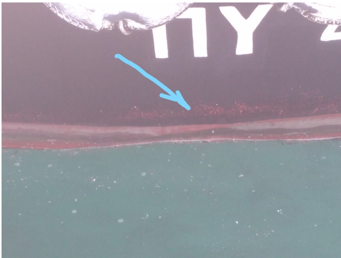
"Inked9 ΡΥΠΑΝΣΗ ΛΙΜΕΝΑ _8-12-2020_LI.jpg"