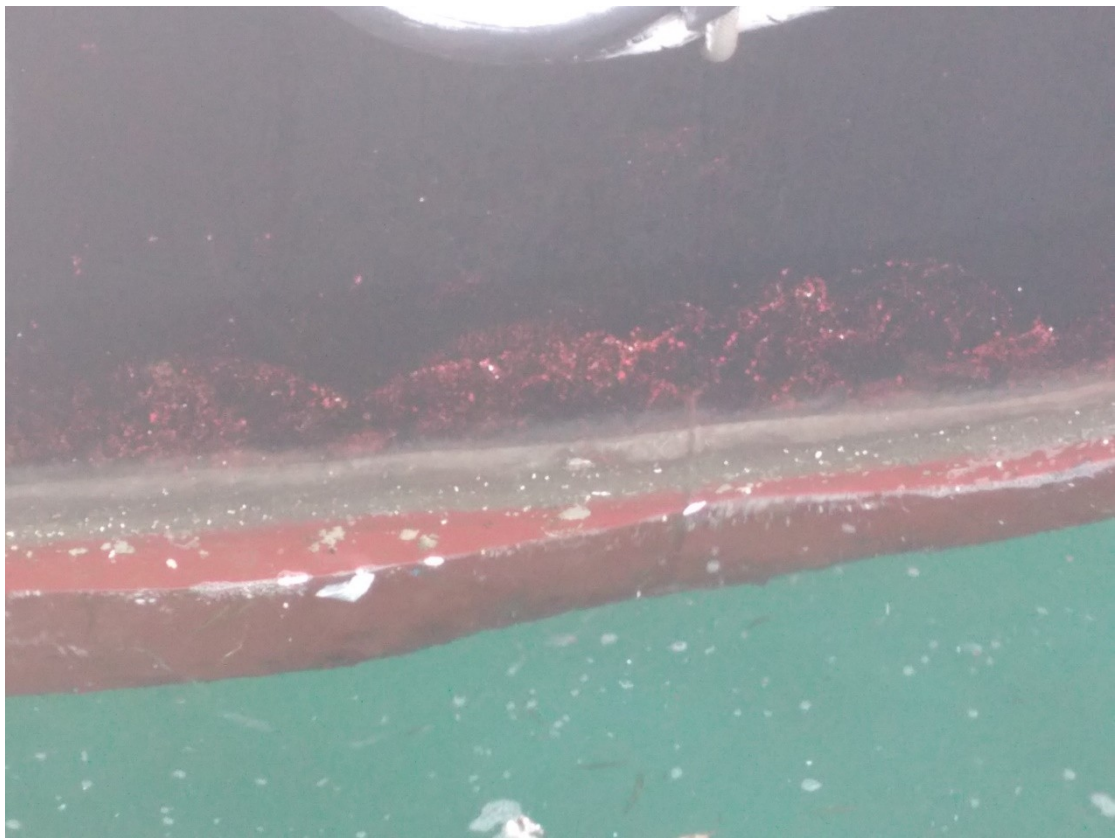
"11 ΡΥΠΑΝΣΗ ΛΙΜΕΝΑ _8-12-2020.jpg"