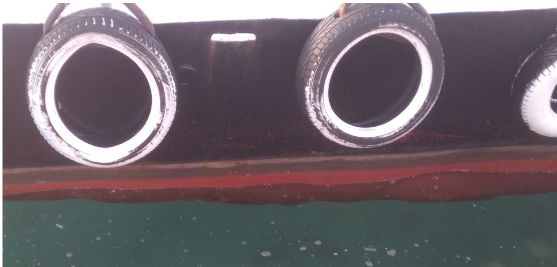
"10 ΡΥΠΑΝΣΗ ΛΙΜΕΝΑ _8-12-2020.jpg"