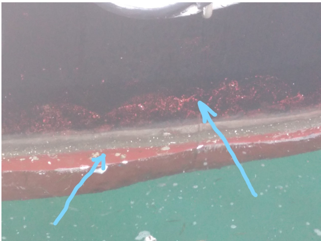
"Inked11 ΡΥΠΑΝΣΗ ΛΙΜΕΝΑ _8-12-2020_LI.jpg"