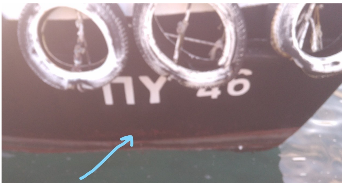
"Inked8 ΡΥΠΑΝΣΗ ΛΙΜΕΝΑ _8-12-2020_LI.jpg"